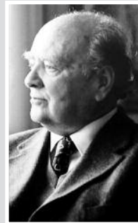
Του Περικλή Βασιλιού

Τόσο οι προηγούμενοι πολιτικοί μας, που ψήφιζαν νόμους, όσο και οι σημερινοί, που «θα ...τους έσχιζαν», έχουν τεράστιες ευθύνες, λάθη, παραλείψεις και ανικανότητα, εναλλάσσονται συνέχεια και βύθισαν τη χώρα στο χειρότερό της σημείο, εδώ και περίπου διακόσια χρόνια, όταν στις 2/4/1827, η Γ' Εθνοσυνέλευση των Ελλήνων στην Τροιζήνα, επέλεξε τον Καποδίστρια, ως πρώτο Κυβερνήτη της Ελ-