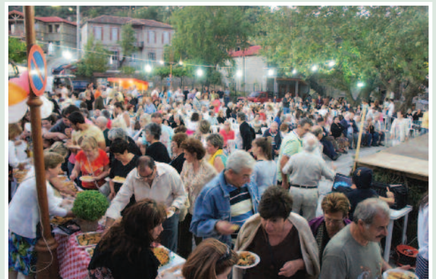
Η πλατεία ήταν γεμάτη στα εγκαίνια του Μουσείου

Ακολούθησαν δημοτικοί χοροί με τα όμορφα παιδιά από το Τμήμα Νέων των Απανταχού Ρεντινιωτών που ξεσήκωσαν τον κόσμο. Συνέχισε το παραδοσιακό συγ-