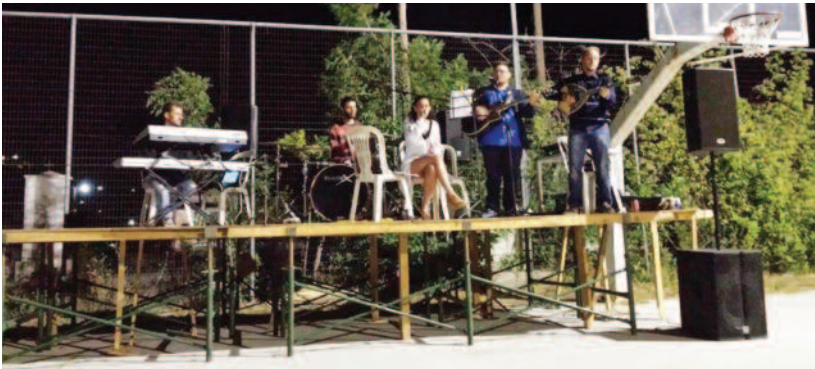
Από την συναυλία που πραγματοποιήθηκε στον Σταυρό στις 15 Αυγούστου