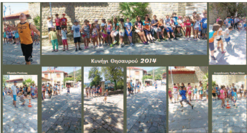
Κυνήγι Θησαυρού 2014