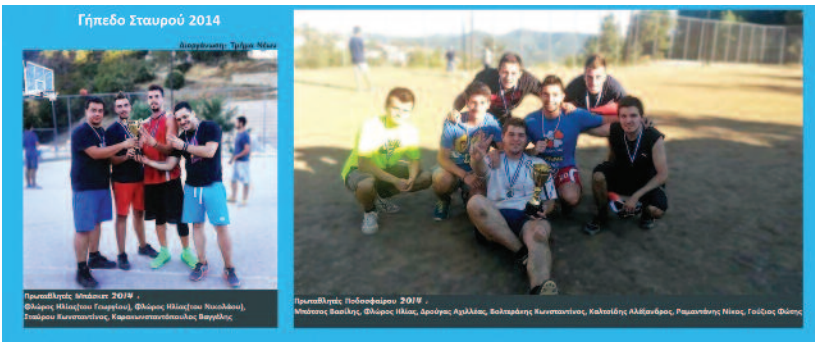
Γήπεδο Σταυρού 2014